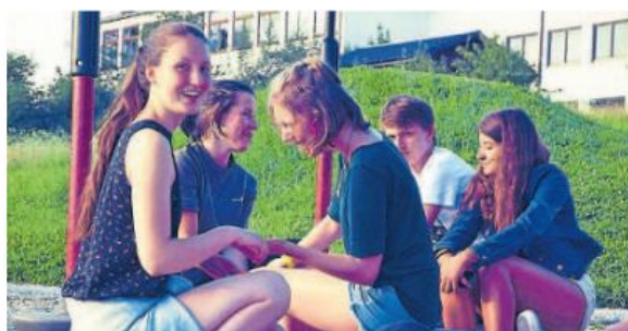
ČESKO-NĚMECKÝ PROJEKT ICH JSEM JÁ přenesou na jeviště portrét života mladých lidí v příhraničních regionech.