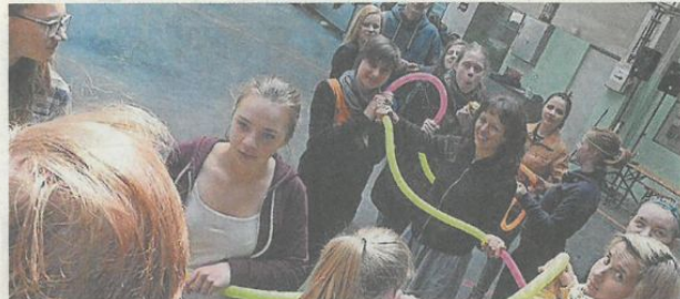
Das cojz Theater Netzwerk bietet ein besonderes Projekt an.

In Bayreuth und Karlsbad beschäftigen sich die Jugendlichen zehn Tage lang mit dem hochaktuellen Thema Privatsphäre – analog und digital. Das Projekt setzt sich damit auseinander,