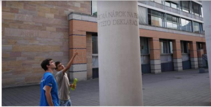
Interessiert studieren die Darsteller die Säulen auf der Straße der Menschenrechte.