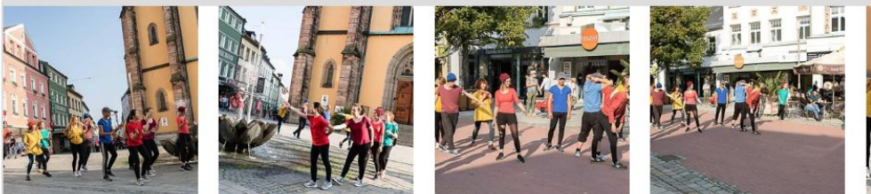
04.09.2018 - Flashmob in der Hofer Altstadt